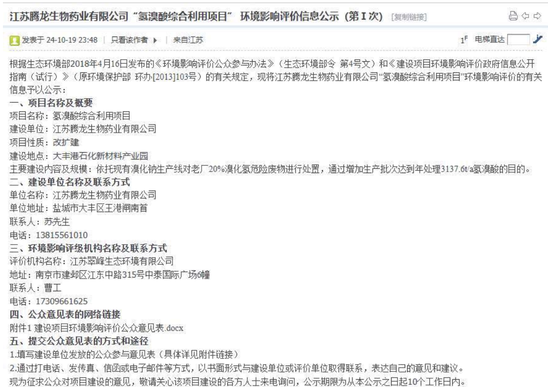
图 2.2-1 首次公示网页截图