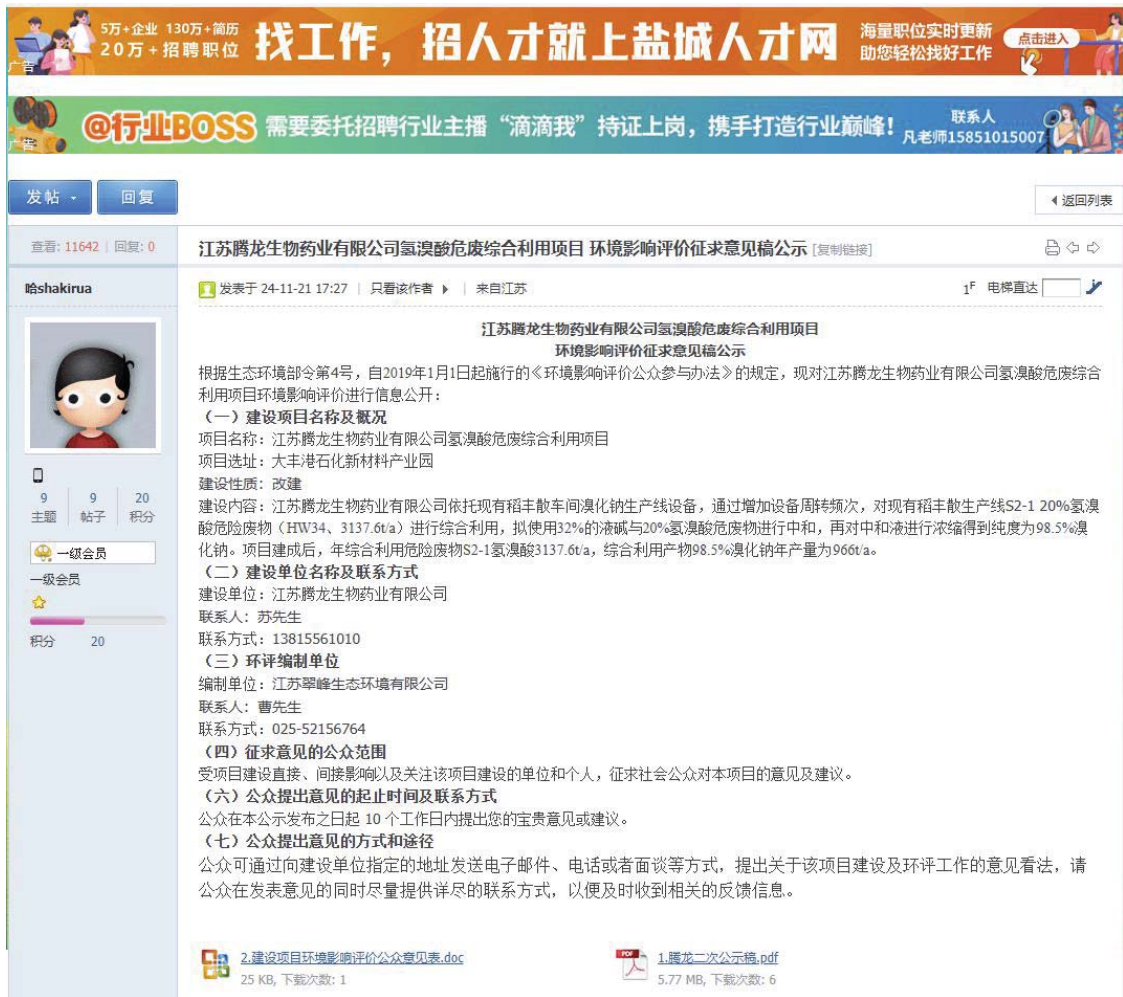
图 3.2-1 征求意见稿公示网页截图